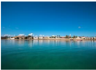
Ilha de Mozambique