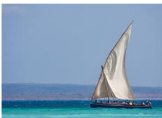
Memba Bay 🚗 330km - ⌚ 5h 30m Pemba