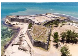
Ilha de Mozambique