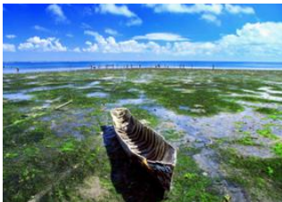
Ilha de Mozambique