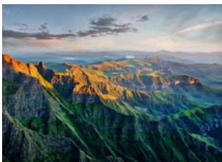
Sabie (Afrique du Sud) 📍