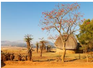
Mlilwane Wildlife Sanctuary (Swaziland) 📍