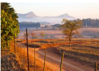
Mlilwane Wildlife Sanctuary (Swaziland) 📍