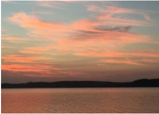
Xai Xai 📍