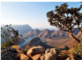
Graskop (Afrique du Sud) 📍