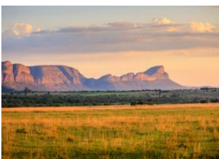
Karongwe Private Game Reserve (Afrique du Sud)