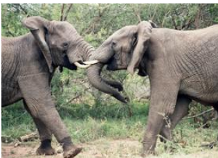
Central Kruger (Afrique du Sud)