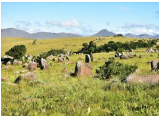
Karongwe Private Game Reserve (Afrique du Sud) 📍