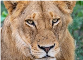
Southern Kruger (Afrique du Sud)